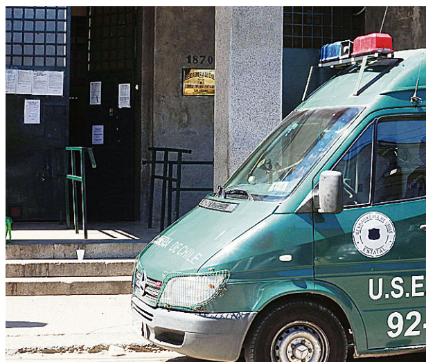
MEDIDA RIGE EN SAN ANTONIO Y EN TODA LA REGIÓN.

Los dos sujetos pasaron ayer a control de detención en el Juzgado de Garantía, donde serían formalizados por el robo con violencia. ★